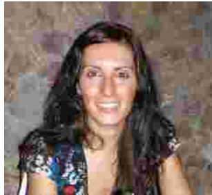
Algunos de los candidatos que usan tumeves.com

Las empresas registradas pueden acceder no sólo a los currícula de personal cualificado, sino también a sus videopresentaciones que permiten observar en tiempo real las habilidades del candidato. Además, esta página cuenta con un buscador avanzado que es capaz de localizar al candidato ideal entre una base de datos en tiempo real especificando tan sólo algunos parámetros. Por último, tumeves.com ofrece un sistema de alarmas, de modo que cuando un candidato se inscribe en una oferta, la empresa recibe un mail con un link a su videopresentación y currículum.